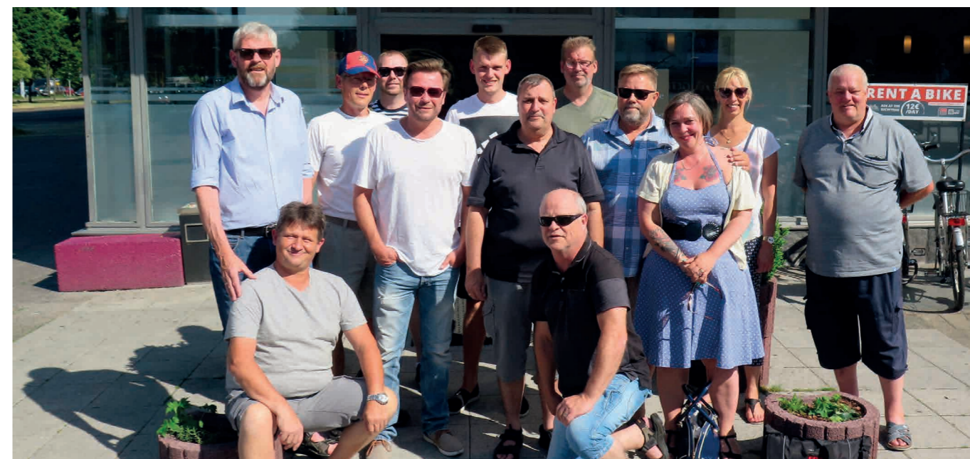
Gruppebillede af deltagerne på turen..

Etteren udkommer 4 gange i løbet af 2018. Vi udkommer i uge 7, 18, 36 og 45.