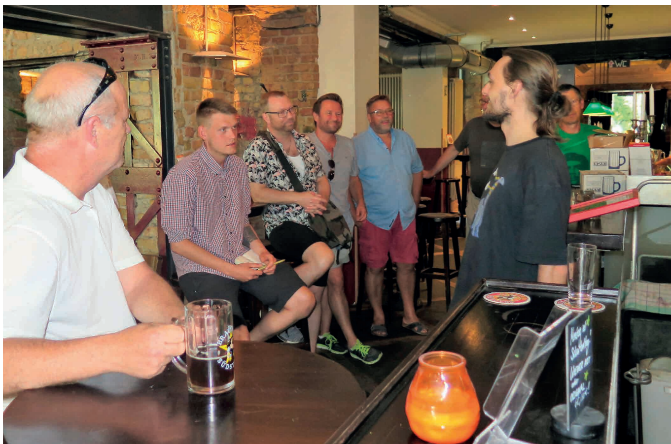
Øl-foredrag og ølsmagning blev der også tid til på turen.

række reformer indført af den socialdemokratiske regering i starten af årtusindet. De indførte en række sanktioner imod arbejdsløse og legitimerede de prekære ansættelser, hvor folk er ansat på korte kontrakter. Efter Hartz-reformerne trådte i kraft, faldt lønningerne for de lavest lønnede tyskere markant, og det har medført, at man ved lov har indført en mindsteløn, der nu ligger på cirka 9 euro i timen.