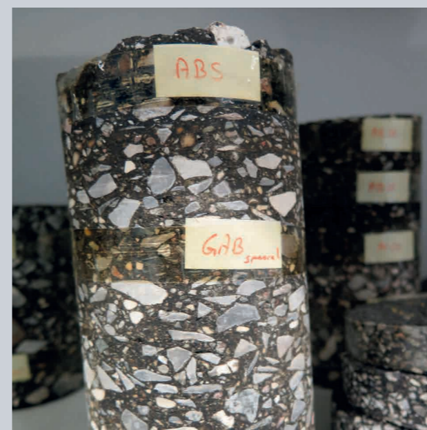
Borekerne fra en asfaltvej.

at en lastbil slider ligeså meget på vejbelægningen som 10.000 personbiler?