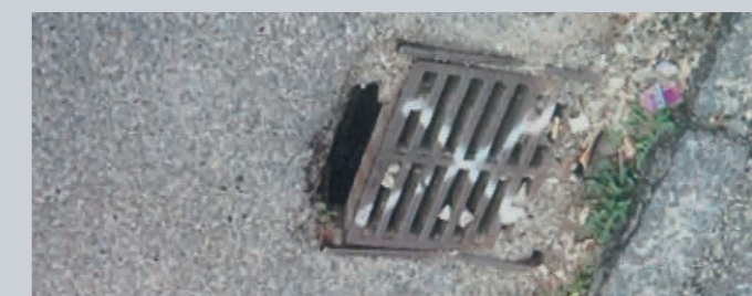
En tæret rist som skal sættes i stand.