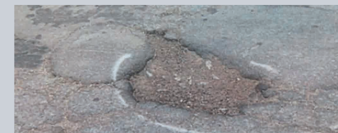
Et hul på en privat fællesvej som skal ordnes.