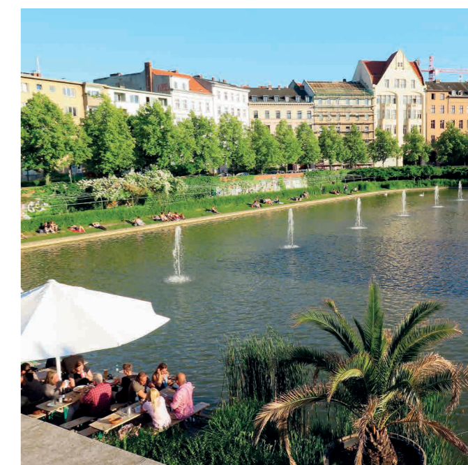
Berlin viste sig fra sin smukkeste side i strålende solskin. Undervejs fandt deltagerne frem til nogle dejlige åndehuller i den varme by.