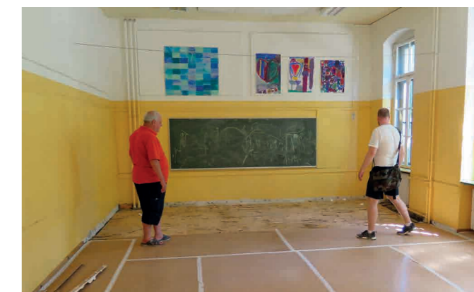
Sommerferien er også den travleste periode for tekniske servicemedarbejdere i Tyskland.

Den sidste eftermiddag hentede bussen os ved hotellet, og vi kørte hjem mod Danmark. Studieturen var en skøn oplevelse, der gav et unikt indblik i arbejderbevægelsen og den fagpolitiske struktur i den fantastiske tyske hovedstad.